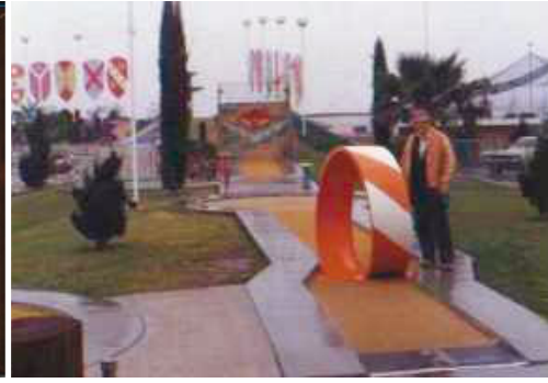
Arne i USA 1976 här vid en gigantisk salto