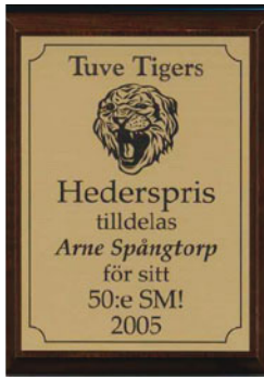
Arne spelade 50 raka SM tävlingar